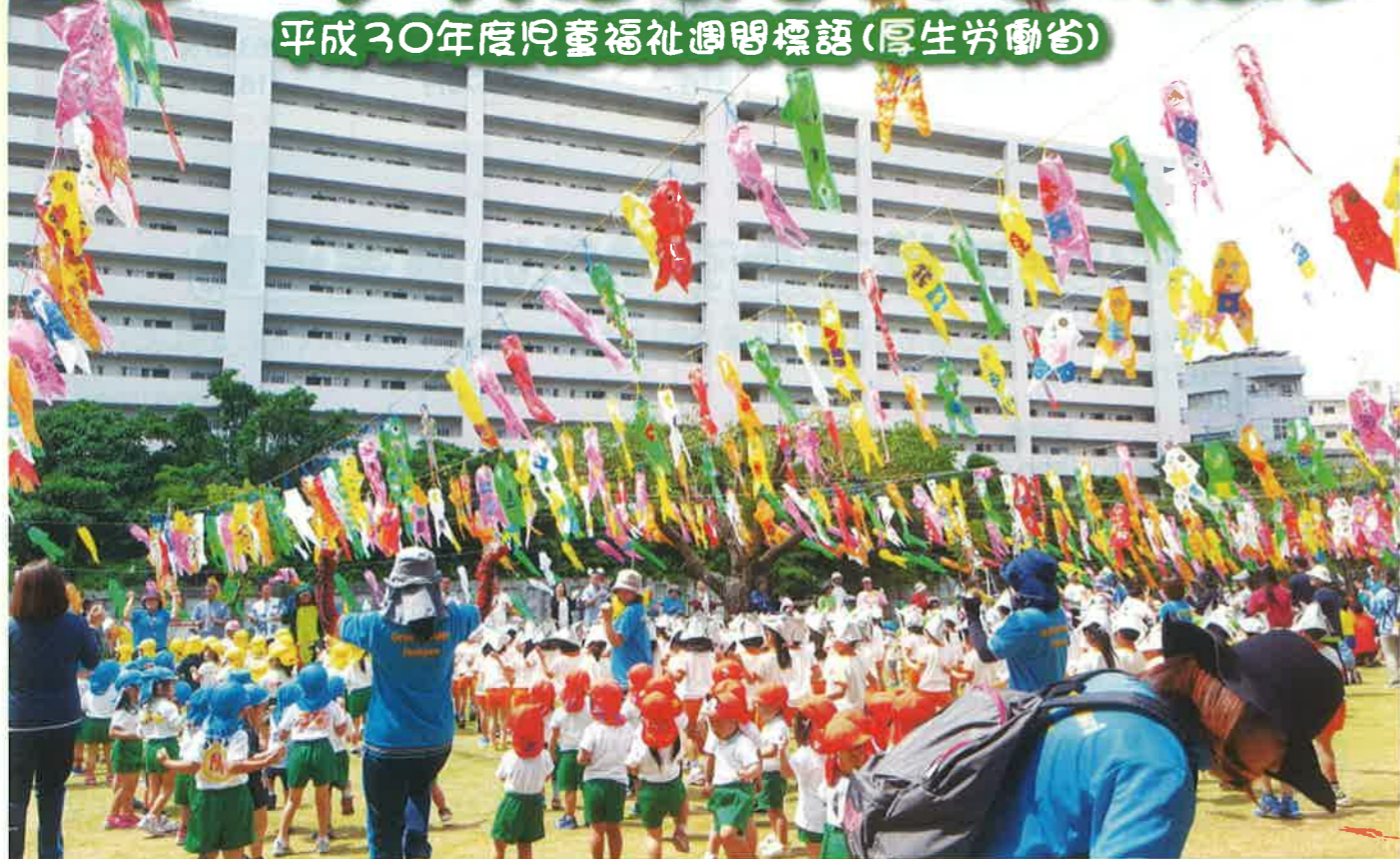
▲内間こいのぼり祭り