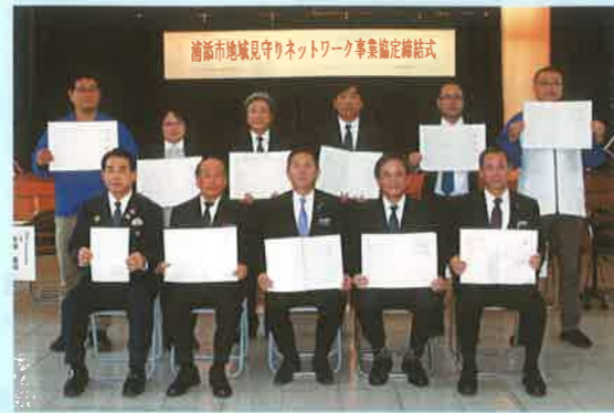
浦添市地域見守りネットワーク事業協定締結式 沖縄ヤクルト(株)、沖縄県農業協同組合浦添支店、沖縄タイムス浦添販売店主会、(株)サニクリーン九州沖縄営業所、(株)てだこ、(株)琉薬、日本郵便(株)浦添郵便局、琉球新報浦添販売店会 (順不同、敬称略)

※協力の申込みを行う団体は「協力申込書」に必要事項をご記入の上、市福祉総務課の窓口又は郵送で申込みをして下さい。